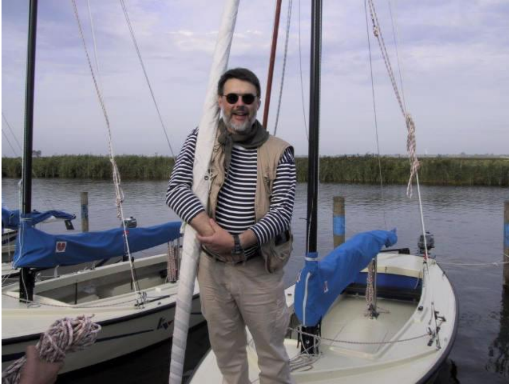
Die Leute im Verein haben sehr schöne Boote und tragen oft auch lustige Sachen dazu