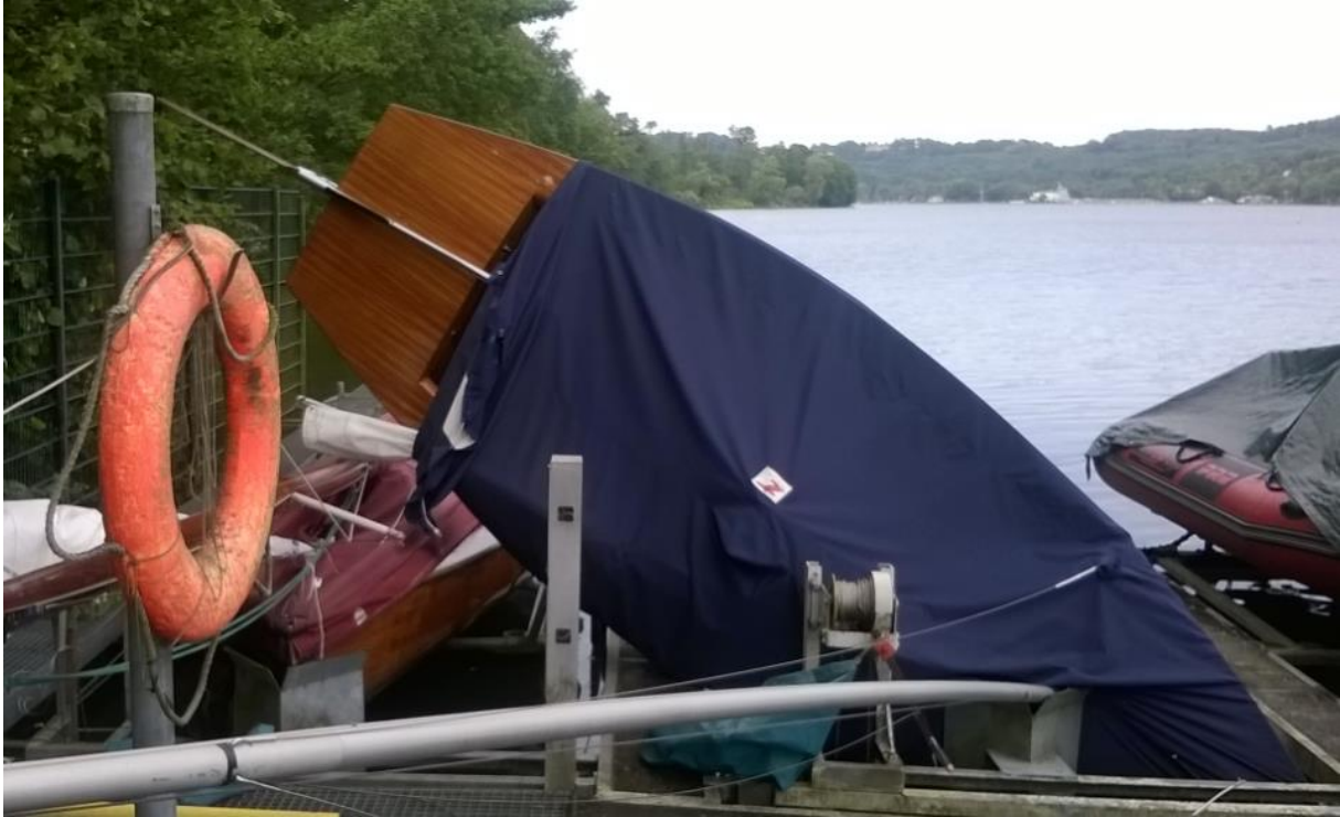
Einige Schiffe machen schon mal Kopfstand