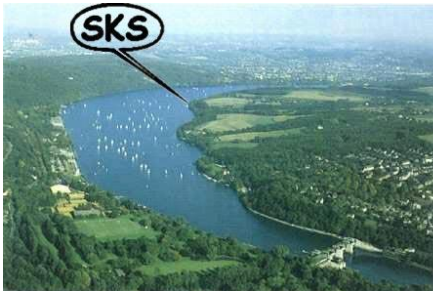
Unser Verein heißt SKS und liegt genau da, wo die Spitze hinzeigt