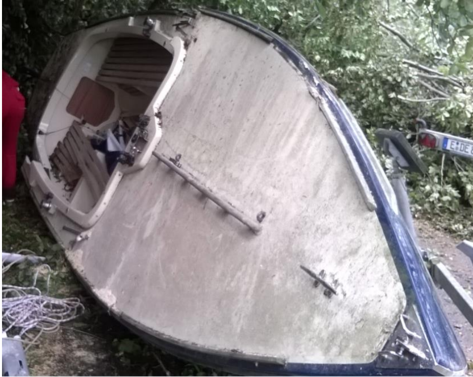
Jetzt ist es richtig kaputt und der Trailer auch