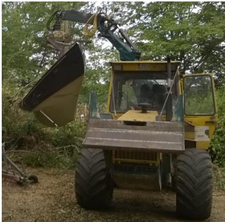
Da muss man es abschleppen