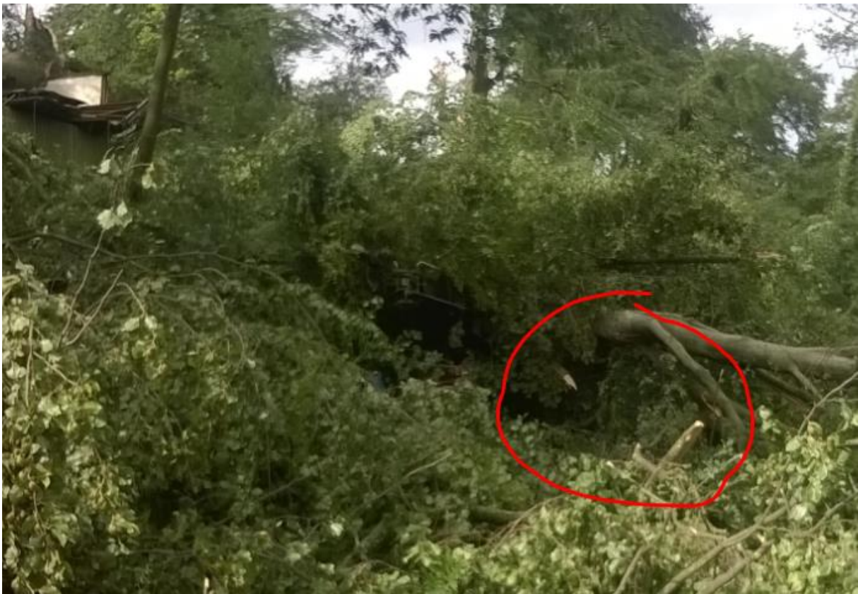
Andere Schiffe verstecken sich. Wer findet das schöne Schiff? Tipp: es ist irgendwo im roten Kreis...