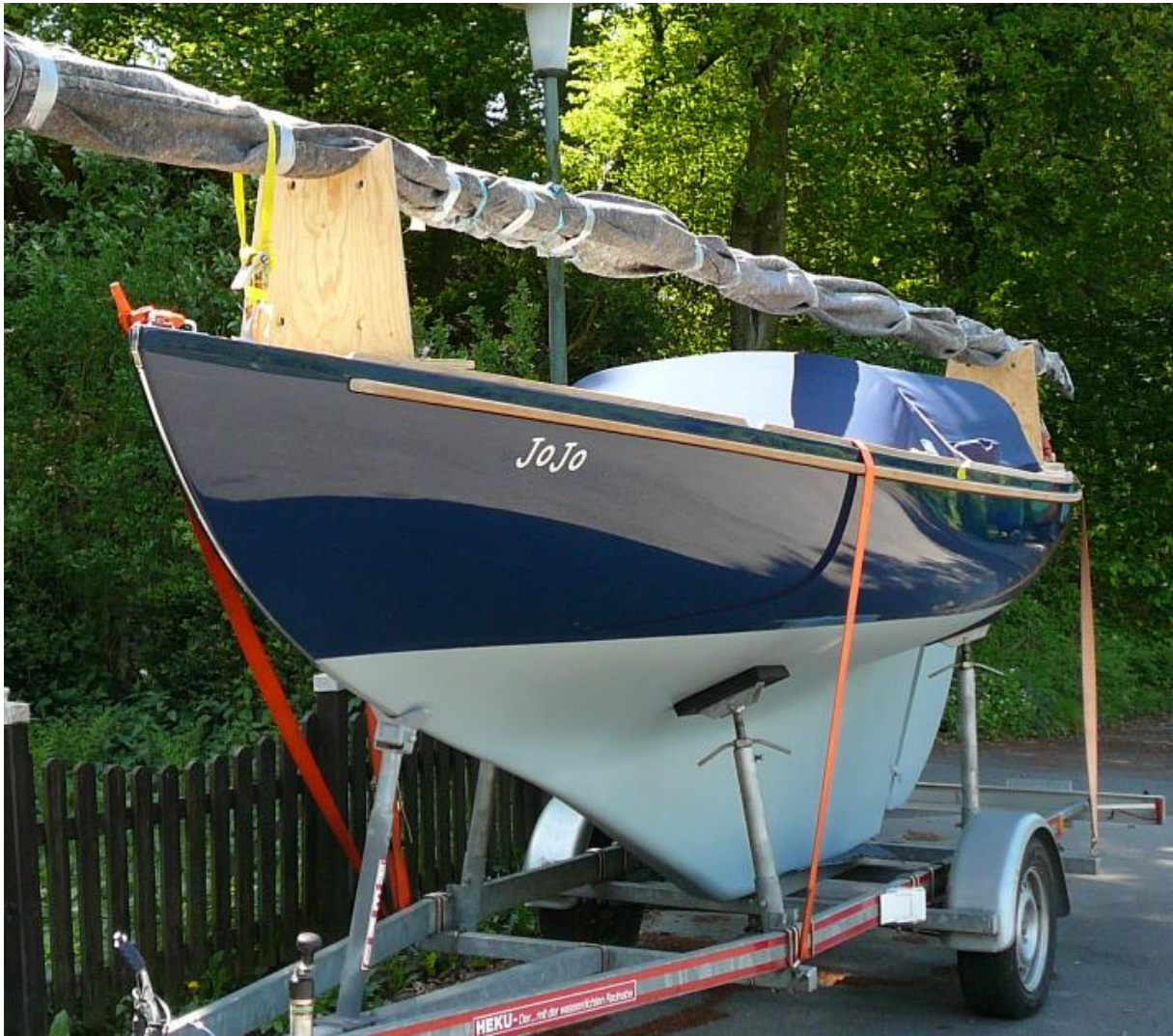
Dafür kauft man dann ein anderes schönes Boot