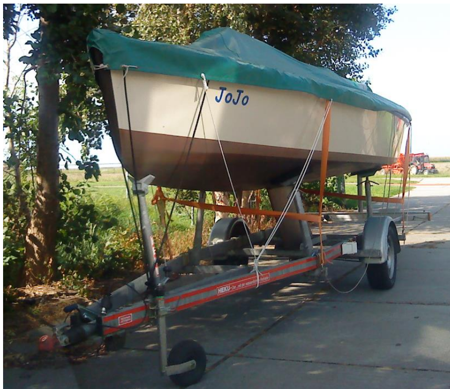
Manchmal wird so ein schönes Boot verkauft