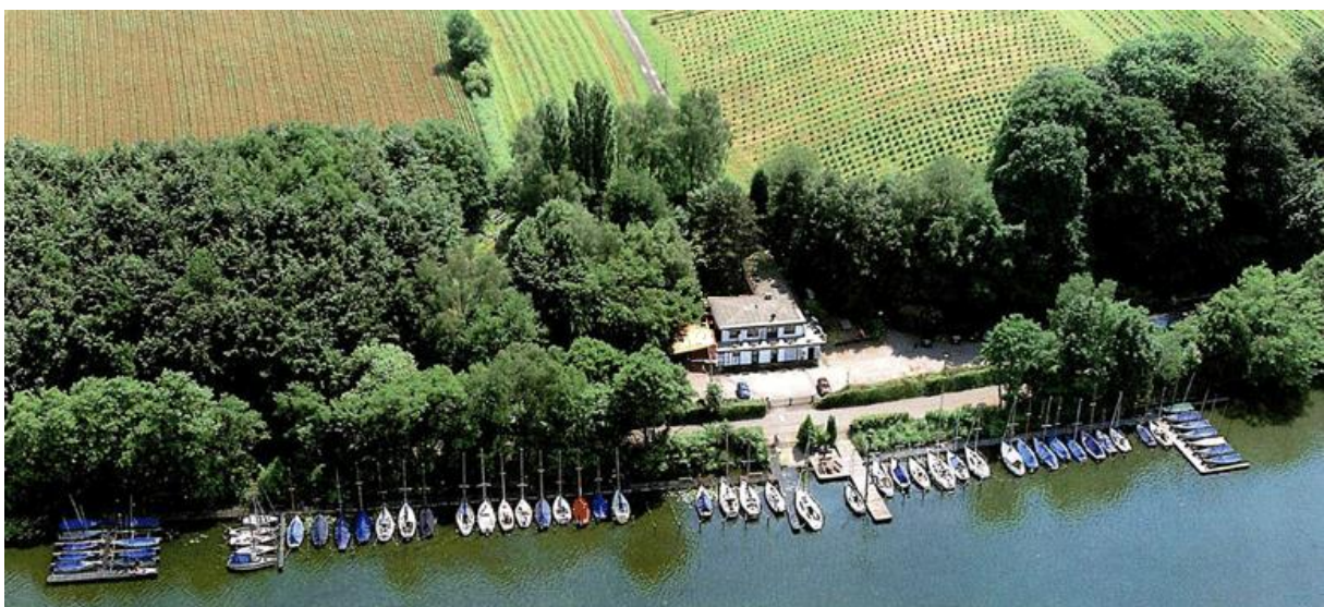
Unser Verein hat auch ein sehr schönes Gelände mit sehr schönen hohen Bäumen drum herum